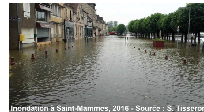
Inondation à Saint-Mammès, 2016