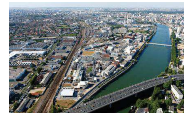
Quartier des Ardoines à Vitry-sur-Seine